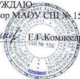
График работы сотрудников МАОУ СШ № 156