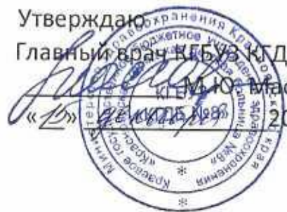
ГРАФИК РАБОТЫ МЕДИЦИНСКОГО КАБИНЕТА МАОУ №156