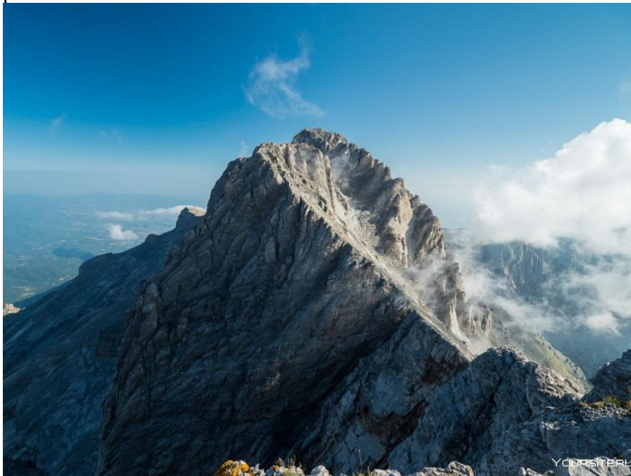
Гора Олимп в Греции

Гора. Следует спросить у обучающихся, как они чувствуют себя в конце урока: на горе, у подножия горы?