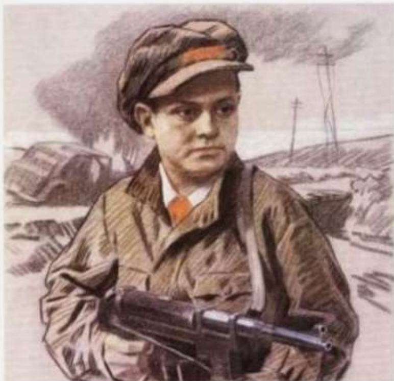
ПРИСВОЕНО звание Героя Советского Союза