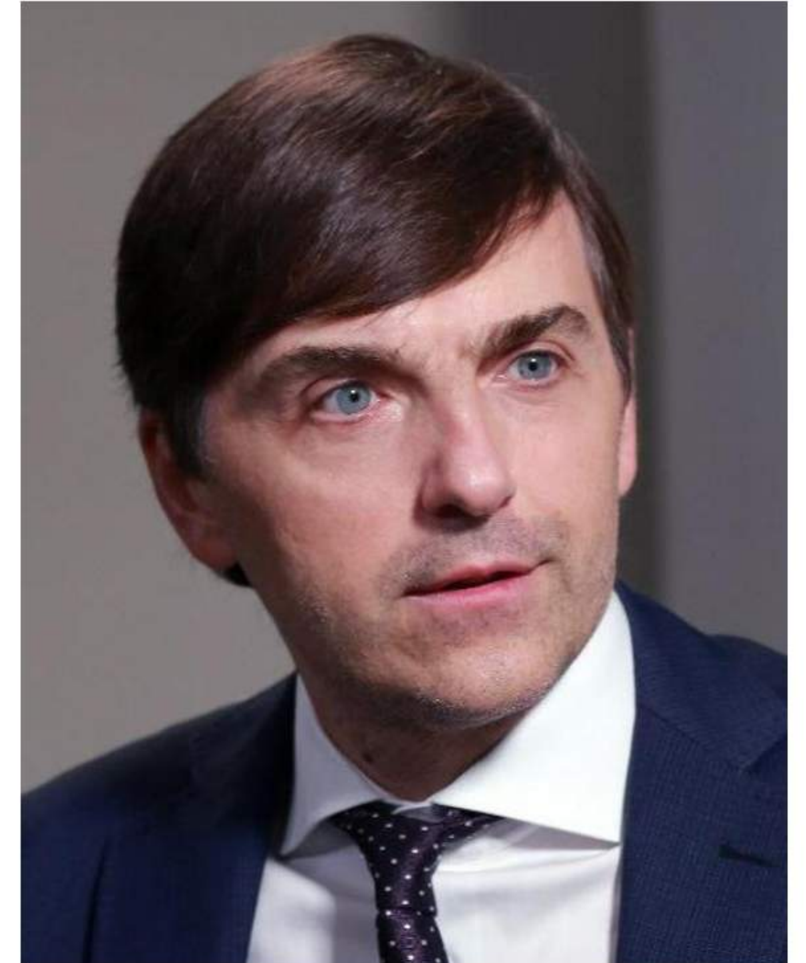
Министр просвещения РФ Сергей Кравцов