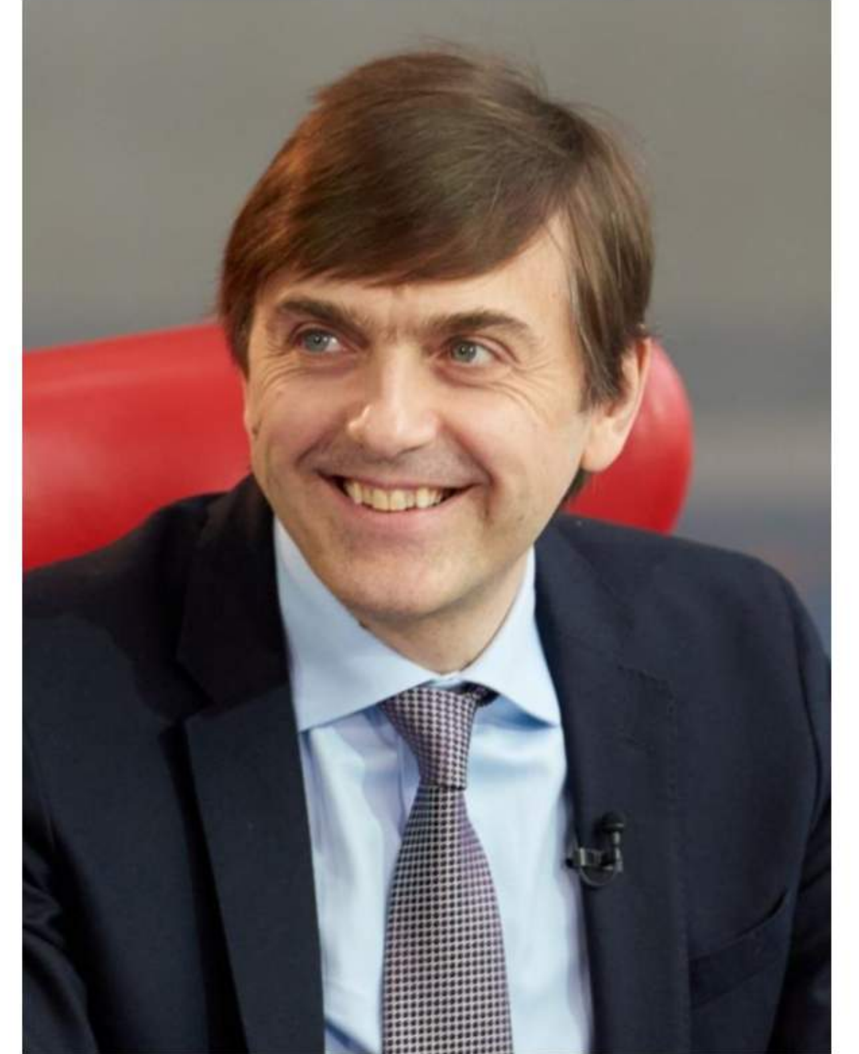
Министр просвещения РФ Сергей Кравцов

Следующее направление – современная инфраструктура, созданная в том числе в рамках национального проекта «Образование». Строятся и ремонтируются школы и детские сады, в также открыты 79 региональных центров, работающих по модели «Сириус», открыто более 250 центров «IT-куб», 365 технопарков-кванториумов, а также более 17 тысяч центров образования цифрового, естественнонаучного, технического, гуманитарного профиля «Точки роста».