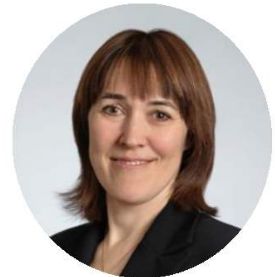
Замглавы Минобрнауки России Петрова О.В.

Реализуемая система федеральных инновационных площадок Минобрнауки России сегодня оказывает всестороннюю поддержку педагогическому сообществу – реализуемая инновационная площадка выступает организатором профессиональных конкурсов и мероприятий, разрабатывает педагогические учебники и пособия, оказывает информационную, правовую, методическую и информационную поддержку работникам образования и реализует и иные важные задачи в системе образования.