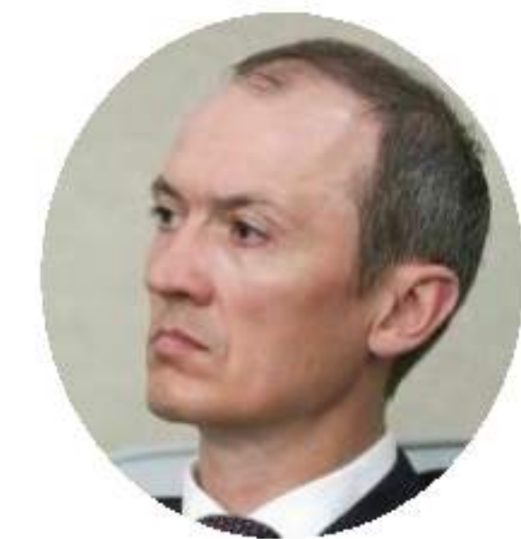
Вице-премьер РФ — руководителя аппарата Правительства Дмитрий Григоренко

Ранее из-за отсутствия финансирования школы и другие бюджетные учреждения могли «не соблюдать какие-то правила», а потом в рамках проверок надзорные государственные органы «наказывали самих себя, вынося штрафы» Это выглядело странно. Мы решили эту задачу, как обещали, у нас на сегодняшний день такие проверки запрещены, это все переведено в режим профилактики, которая запрещает штрафовать, но при этом дает рекомендации на предмет выявления нарушений и исправления, если такие есть