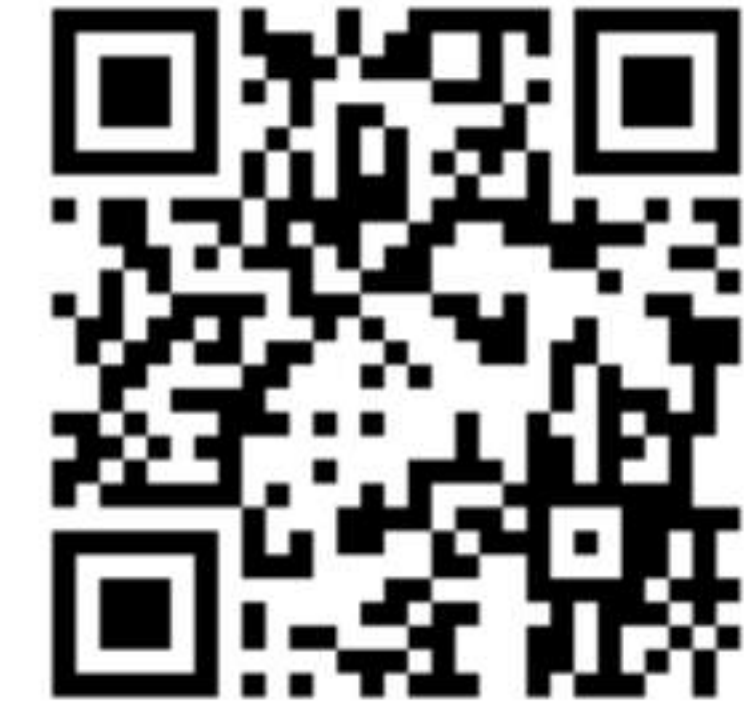
Единый календарь образовательных событий Минпросвещения России

Среди организаторов событий, размещенных в календаре, педагогические вузы Минпросвещения России, Московский государственный университет имени М.В. Ломоносова, АНО «АПГИ» и другие организации.